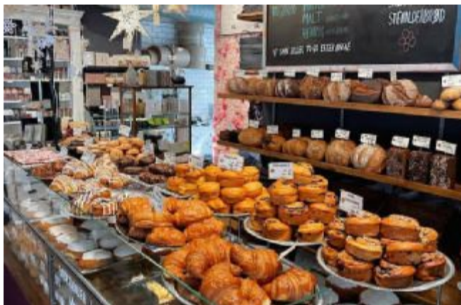
Penny Lane har alt, hvad man skal bruge af bagværk og kaffe til turen hjem fra Aalborg.

Kunsten i Aalborg er det eneste museum, den finske arkitekt Alvar Aalto har tegnet. Museet er fyldt med marmor både på inder- og ydersiden, upraktisk, har det vist sig, i det danske vejr, men helt vildt flot.