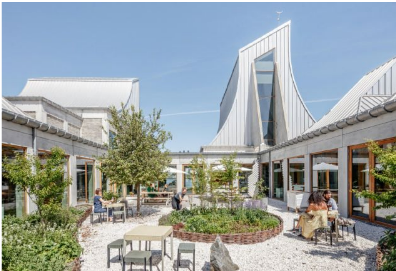
I klassisk Utzon-stil har Utzon centeret en have i midten og store glaspartier.

I den nordjyske hovedstad er der kunst og kultur nok til en hel weekend – og du kan få det både på gadehjørner og i marmorhaller