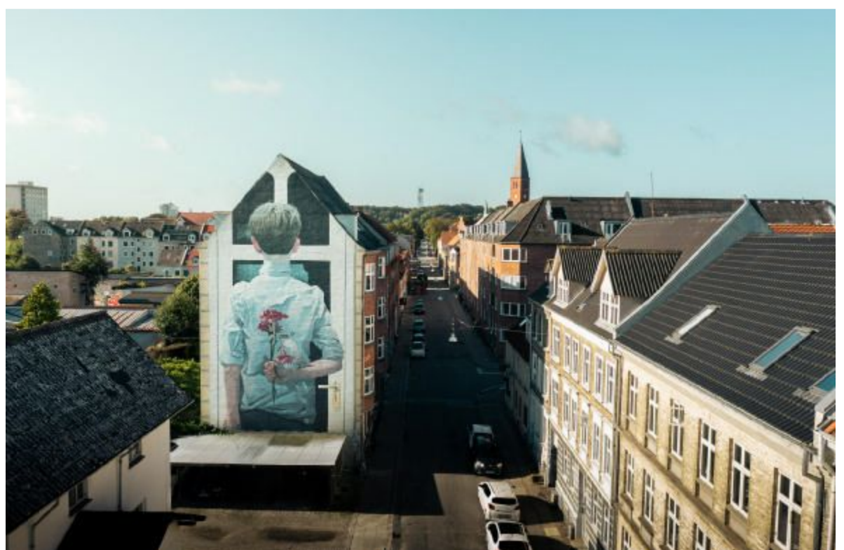
I Aalborgs gader er omkring 90 gavle blevet til streetartkunstværker.

For de fleste er en tur til Aalborg lig med lang transporttid. Køb en kop kaffe og bolle, croissant eller kardemommesnurrer med fra caféen Penny Lane, og forsøg hjemrejsen en smule. pennylanecafe.dk