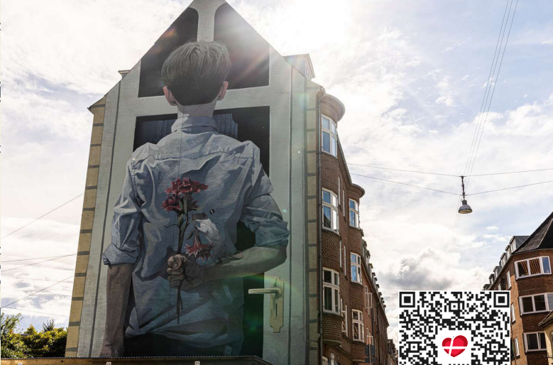
Copyright: BEZT · Meeting her Parents · Absalonsgade 34